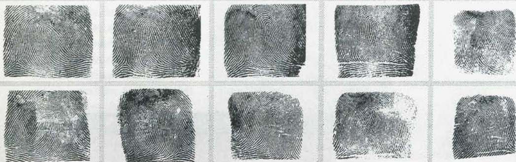
Photograph taken 1966

ALIASES: Eldridge Cleaver, Leroy Eldridge Cleaver, Jr.