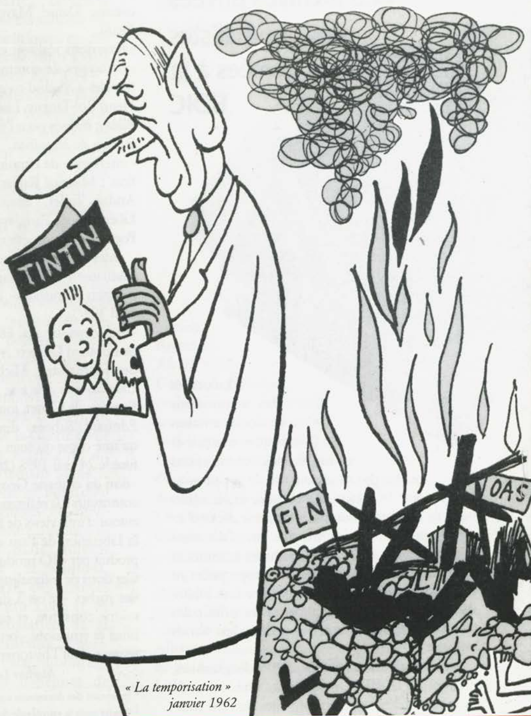
« La temporisation » janvier 1962