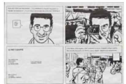
Planche d'encre de Emmanuel Guibert pour l'album Le photographe (tome 1).