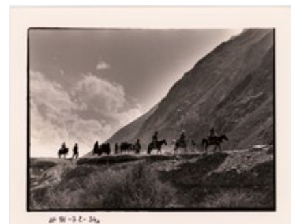
Des mines de Lapiz jusqu'au pied du col Arash : passage du plateau après Andjuman, Afghanistan, septembre 1986.