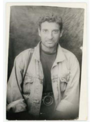
Portrait de Didier Lefèvre devant la guest house de l'UNICEF à Kaboul, 1996.

Si les archives de Didier Lefèvre sont traversées par ces deux fils rouges, elles dévoilent aussi d'autres facettes plus prosaïques du métier de reporter, en particulier le travail souterrain qui s'opère au jour le jour, au fil des événements internationaux, de la vie politique locale ou des commandes de portraits qui font le pain quotidien des photographes. Elles recèlent aussi des ensembles inattendus, révélant ses sujets de prédilection et son goût pour le spectacle du monde comme pour les moments de latence, cristallisant le temps élastique, tissé d'ennui et de surprises, qui caractérise sa pratique de la photographie.