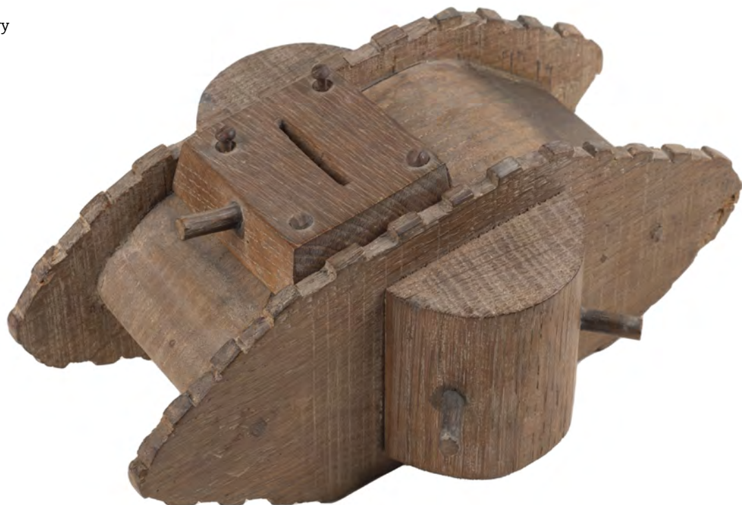
7. TANK EN BOIS TIRELIRE, [1914-1918], ANGLETERRE, COLL. LA CONTEMPORAINE, OBJ 2544