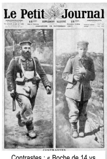
Contrastes : « Boche de 14 vs

Richesse de la BDIC, la presse de la Première Guerre mondiale est constituée notamment de journaux de tranchées, pour soldats, bulletins du front ou encore de propagande des différents belligérants. Les collections de presse illustrée occupent une place importante dans cet ensemble.