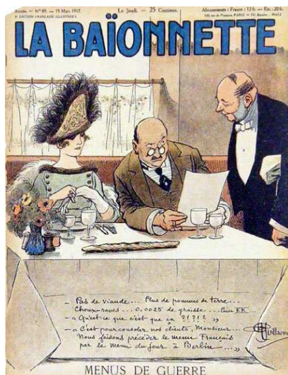
« Menus de guerre », mars 1917