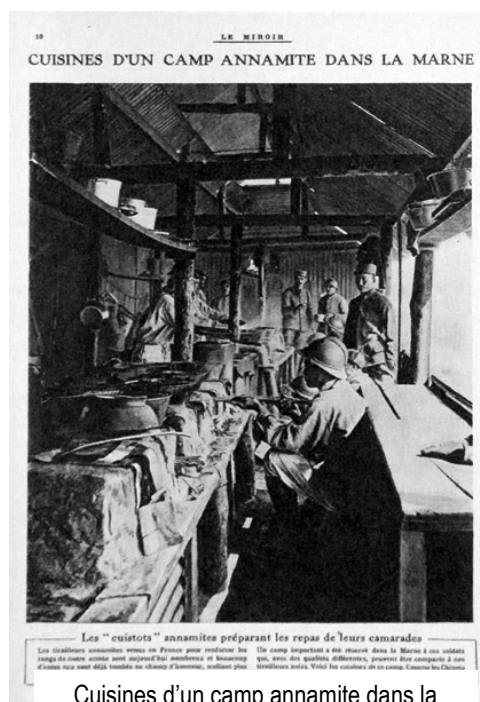
Cuisines d'un camp annamite dans la Marne » 1-7 juillet 1917

Cote : FP 228 Coll BDIC no. 17 (jul-1912) ; no. 18 (mar-1914) ; no. 36 (aoû-1914) -no. 343 (jul-1920) ; n.s. no. 3 (jul-1920) -no. 26 (dec-1920) ; n.s. no. 9 (oct-1939) ; no. 41 (jun-1940)