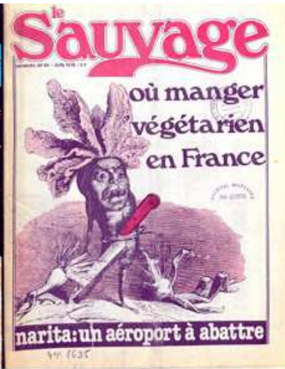
Unes des n° 69, 15 septembre 1979 et 54, juin 1978