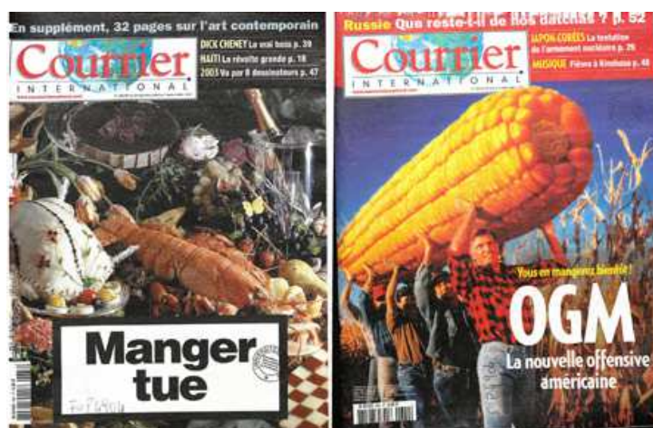
Unes des n° 686-687, 24/12/2003 et 660, 26/06/2003