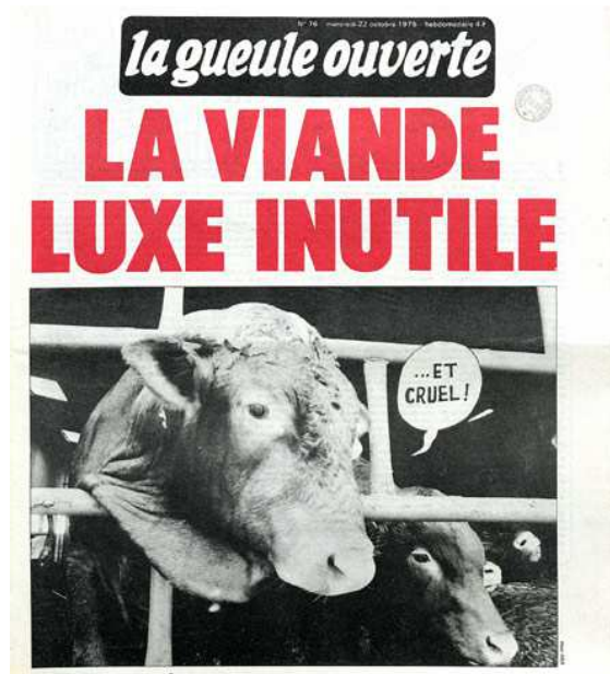
Une du n°76, 22 octobre 1975