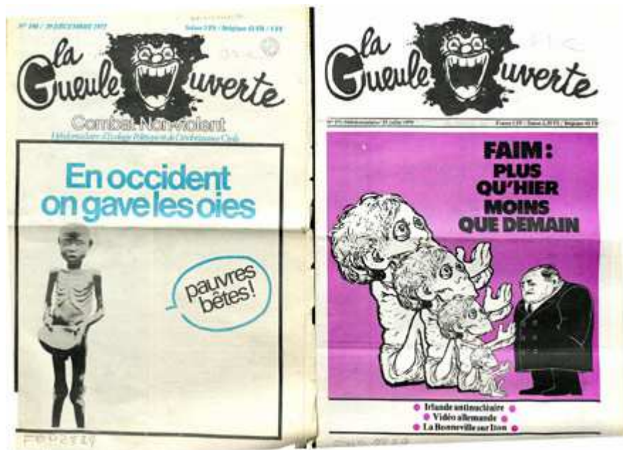
Unes des n° 190, 29 décembre 1977 et 271, 25 juillet 1979