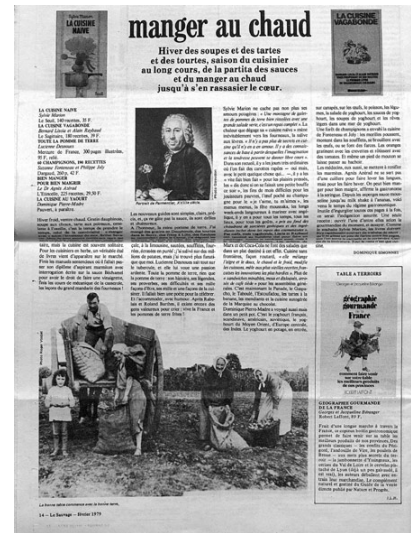
« Manger chaud », article paru dans le n° 62, février 1979