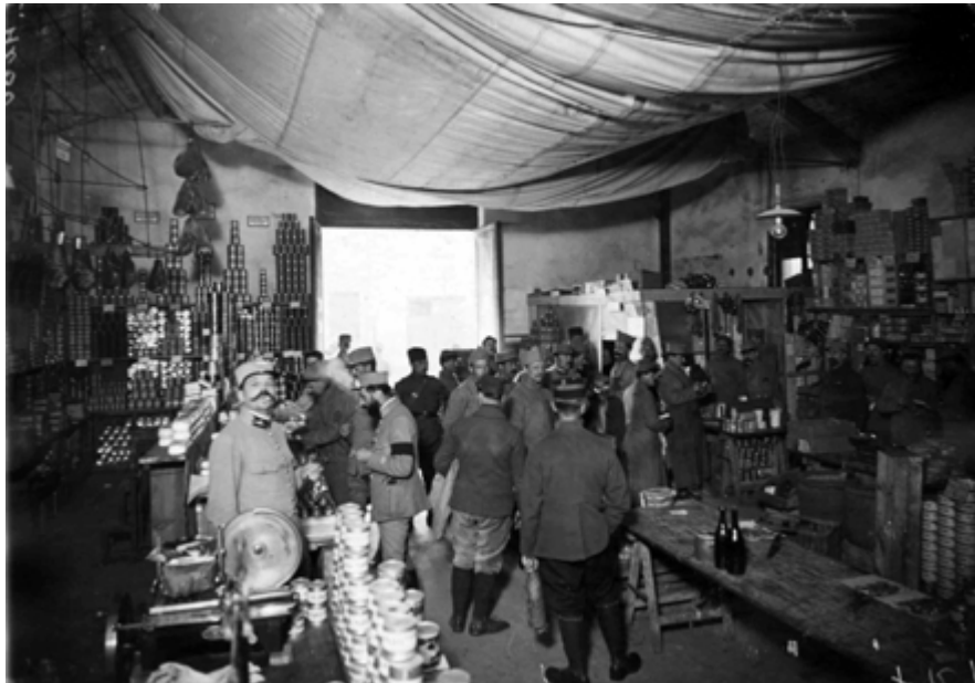
Coll.BDIC. Le magasin Oliar, épicerie militaire, Toul, mai 1918

France, Ministère de la Guerre, Service des subsistances militaires. Notice sur les conserves de viande, l'installation et l'utilisation des établissements frigorifiques 1915