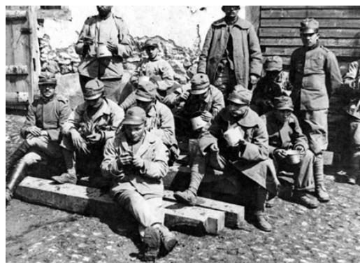
Bourbach le Bas, 25 avril 1918. Soldats italiens au cantonnement : l'heure de la soupe

Schwichtenberg, Helmut. Die wirtschaftlichen Voraussetzungen und Methoden der Erzeugungsschlacht . 1941