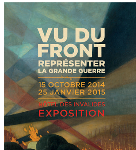
Catalogue de l'exposition Vu du front. Représenter la Grande Guerre . Somogy/BDIC / Musée de l'armée, 2014. En couverture : Felix Vallotton, Verdun, 1917

Cette nécessité de plaire à un public large est parfois difficile à concilier avec les exigences scientifiques élevées qui président à la conception des expositions d'un établissement universitaire. La valorisation de l'institution et de ses collections, passe par une programmation en phase avec les avancées historiographiques les plus récentes. Les commissaires d'exposition sollicités pour la direction des ouvrages sont des chercheurs, spécialistes du sujet abordé. L'exercice d'écriture imposé par les multiples destinations des textes (milieux académiques, public amateur, médias spécialisés) n'est pas d'une exécution facile. Mais cette collaboration entre institution patrimoniale et