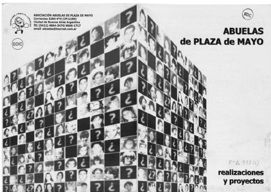
Brochure non datée, Asociación abuelas de plaza de mayo , Fonds Madres de la plaza de mayo, coll. La contemporaine, en ligne sur L'Argonnautte.

Par ailleurs, La contemporaine a vu sa candidature retenue dans le cadre de l'appel à projets 2018. Avec Réseaux pluridisciplinaires et pratiques documentaires : les transitions politiques en Amérique latine dans les années 1960/2000 , projet conçu en partenariat avec l'Institut des hautes études sur l'Amérique latine (IHEAL), en lien avec le GED du campus Condorcet et l'Institut des sciences sociales du politique (ISP), deux objectifs sont visés : identifier les réseaux de chercheurs, américanistes ou non, travaillant sur cette aire géographique, et analyser leurs pratiques documentaires actuelles. Deux journées d'étude seront organisées et une enquête sera menée auprès des chercheurs. Une attention toute particulière sera portée aux archives orales qui