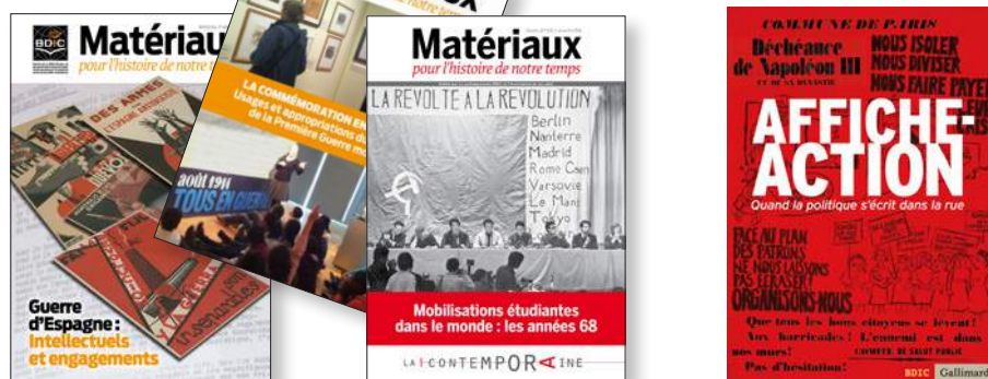
Capture d'écran de la revue Matériaux pour l'histoire de notre temps consultable sur le portail Cairn.info.