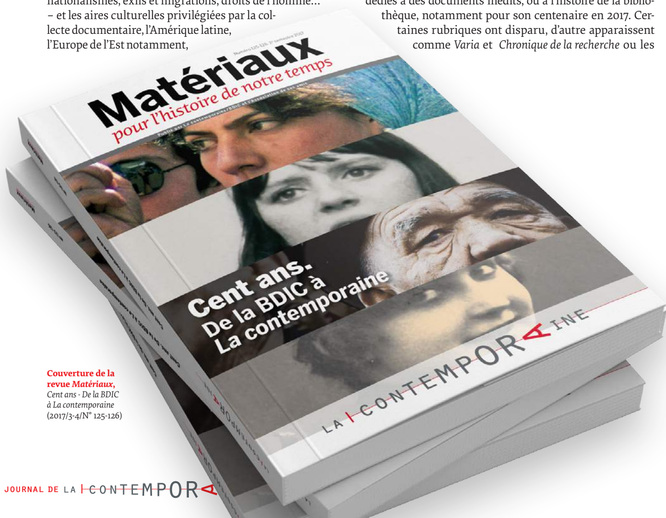
Couverture de la revue Matériaux , Cent ans - De la BDIC à La contemporaine (2017/3-4/N° 125-126)

Tous les numéros de Matériaux s'appuient sur l'usage privilégié des ressources documentaires de La contemporaine et les valorisent. Les fonds récemment entrés sont présentés et analysés par les responsables de leur conservation eux-mêmes. Des recensions font échos aux expositions du musée d'histoire contemporaine. Des dossiers ont été entièrement dédiés à des documents inédits, ou à l'histoire de la bibliothèque, notamment pour son centenaire en 2017. Certaines rubriques ont disparu, d'autres apparaissent comme Varia et Chronique de la recherche ou les