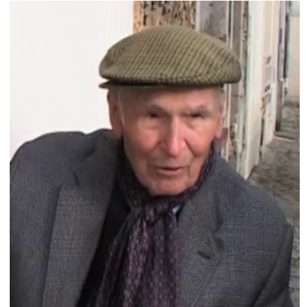
Lazare Ponticelli, 2004

“ Nous sommes partis à la guerre sans nous poser de questions. Quand j'ai quitté la maison, ma mère était émue. Elle m'a dit « sois brave, mon fils... » On était très vite comme des frères sur le front. Il y avait beaucoup de solidarité, même avec les chefs ”