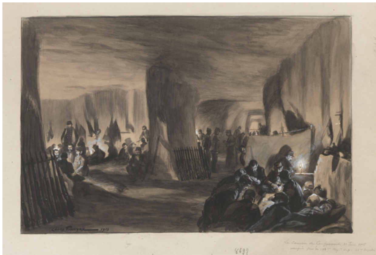
Louis Tinayre, La carrière de Confricourt, 1 er janvier 1915, occupée par le 198 ème régiment d'infanterie, 25 ème brigade. Dessin à l'encre de Chine, numérisé dans le cadre de la Grande Collecte. Coll. particulière

Les personnes qui souhaiteraient donner leurs archives à la BDIC peuvent écrire à cette adresse : dons@bdic.fr