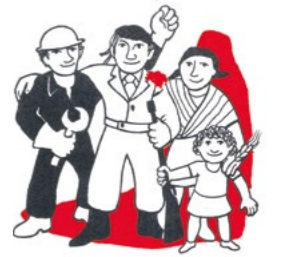
Affiche, coll. la Contemporaine, DM2343A023.

Jeudi 30 mai, 18h, la Contemporaine, salle 2 Conférence de Vincenzo Russo (Université de Milan) La résistance continue : le colonialisme portugais, luttes de libération et les intellectuels italiens.