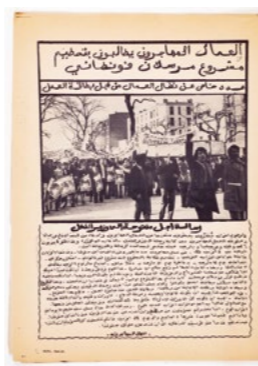
Tract, coll. la Contemporaine, ARCH0057_09_3_08