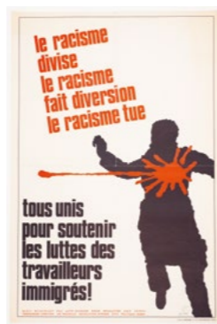
Affiche, coll. la Contemporaine, LC_AFN502A12